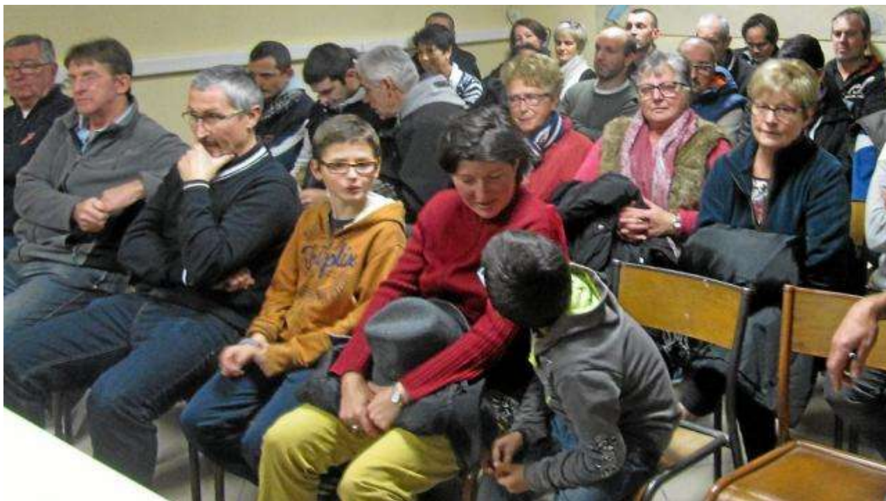
De nombreuses personnes ont assisté à l'assemblée générale du club de pétanque, vendredi soir.