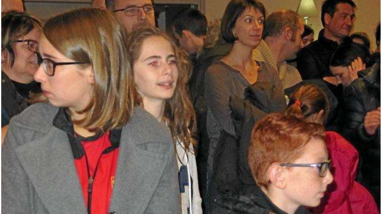
Les représentants de plusieurs clubs sportifs ont été récompensés.

L'idée. Vendredi soir, la municipalité a annoncé, qu'après un an et demi de travaux, le second gymnase ouvrira ses portes lundi 28 novembre. « C'est une reconnaissance de la Ville pour les associations qui oeuvrent au quotidien. Le sport est une école de la solidarité, de l'abnégation et du courage. »