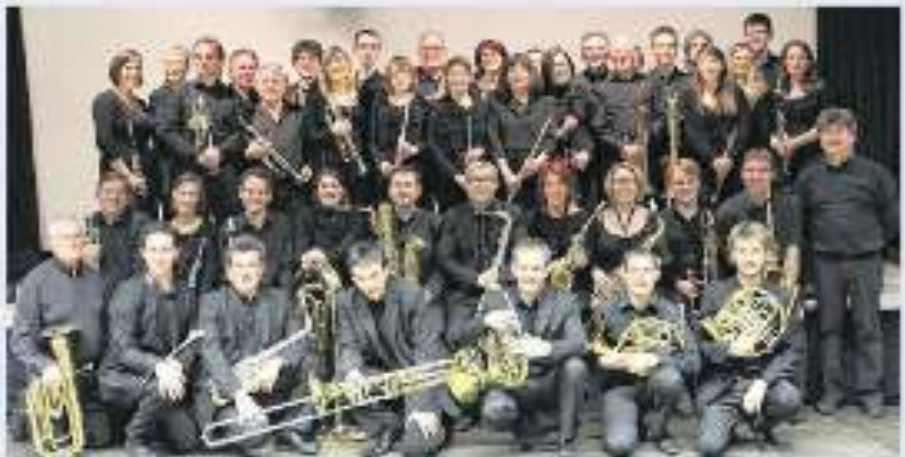
L'orchestre d'harmonie de la Société Musicale Normande en concert samedi à Argences.