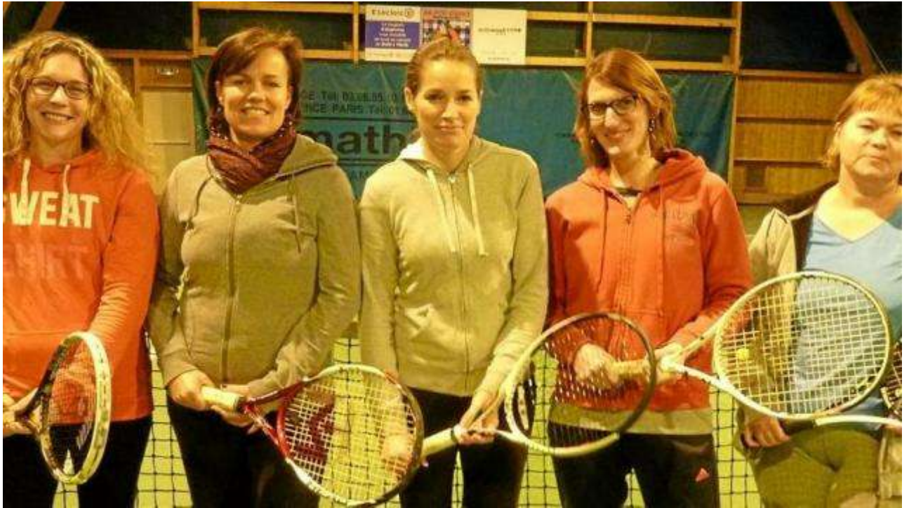
La nouvelle équipe féminine a bien figuré en championnat.