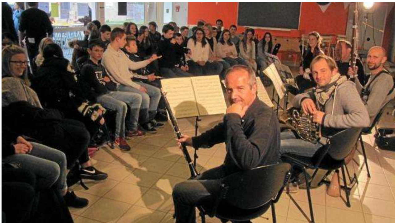
Les musiciens de l'Orchestre régional de Normandie et un groupe d'élèves de 4e.