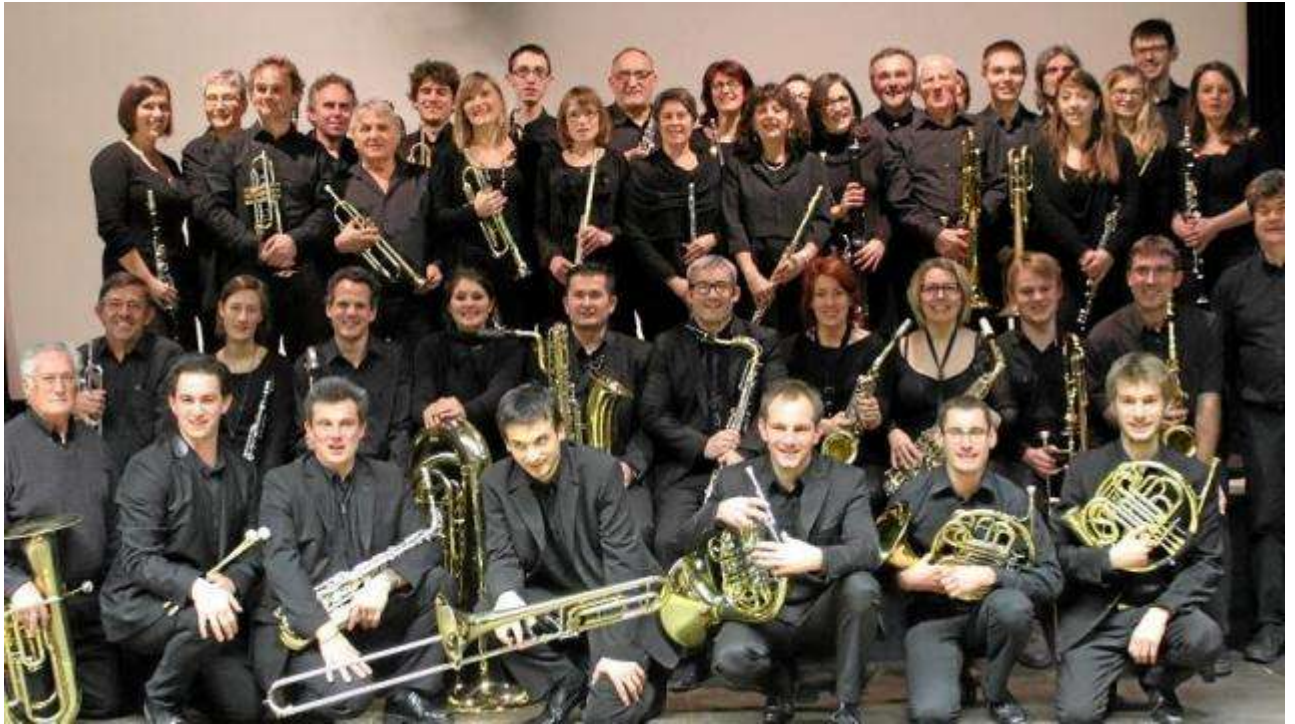
L'orchestre de la Société musicale normande qui animera le concert de samedi.