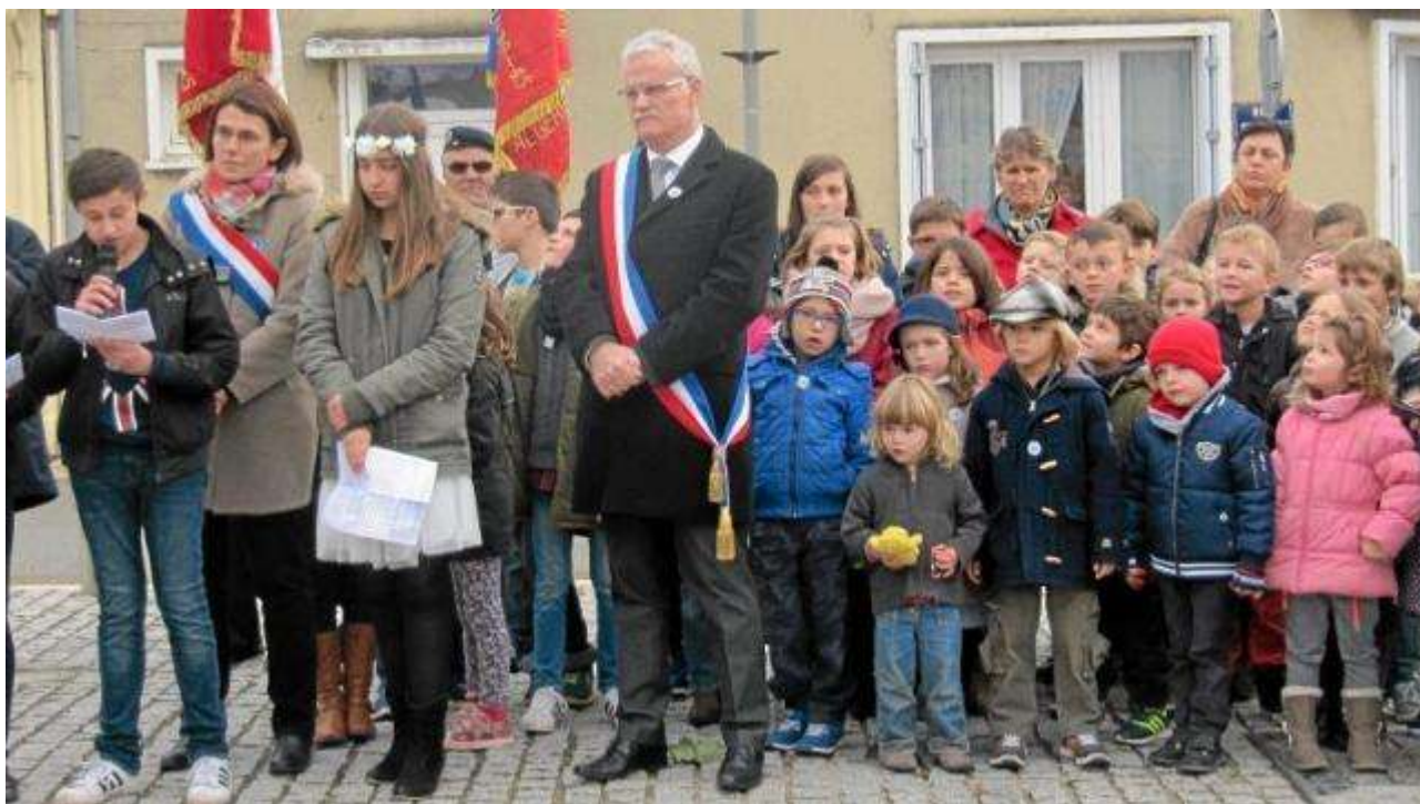
Les jeunes en présence de la députée, du maire et des enseignants.

Vendredi matin, de nombreuses personnes ont célébré l'Armistice. Après avoir défilé dans les rues de la commune, le cortège s'est arrêté au monument aux morts, place du Forum. Les sonneries réglementaires ont été assurées par la fanfare. Laurence Dupont députée, les porte-drapeaux de la section locale des anciens combattants, la Fédération nationale des anciens combattants en Algérie (Fnaca), plusieurs associations d'anciens combattants, des sapeurs-pompiers, ainsi que des élus étaient présents.