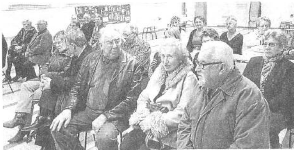
L'amicale n'est pas satisfaite du nombre de dons de l'année 2013.