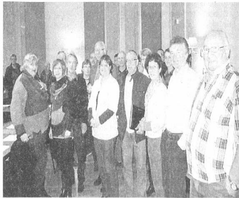
Des représentants d'associations, présents pour l'établissement du calendrier.

Samedi 3, soirée club karaté Val-ès-Dunes ; jeudi 8, rando pommiers fleuris ; jeudi 15, spectacle Aposa ; samedi 17, loto du judo ; dimanche 18, vide-greniers tennis ; jeudi 22, collecte de sang au forum ; samedi 24, concert école musique Pom ; vendredi 30 et samedi 31, festival Familles rurales au forum.