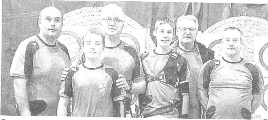
Bonne moisson de médailles pour les Argençais à Falaise.

Départ en trombe pour les archers cette année