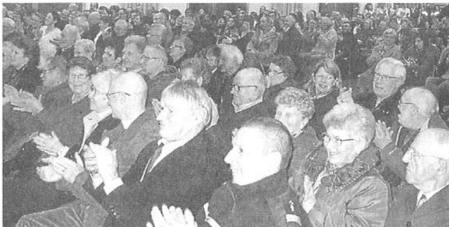
Le Forum avait fait le plein samedi pour les vœux du maire.

Au futur lotissement de l'Orée-d'Argences, seize permis de construire