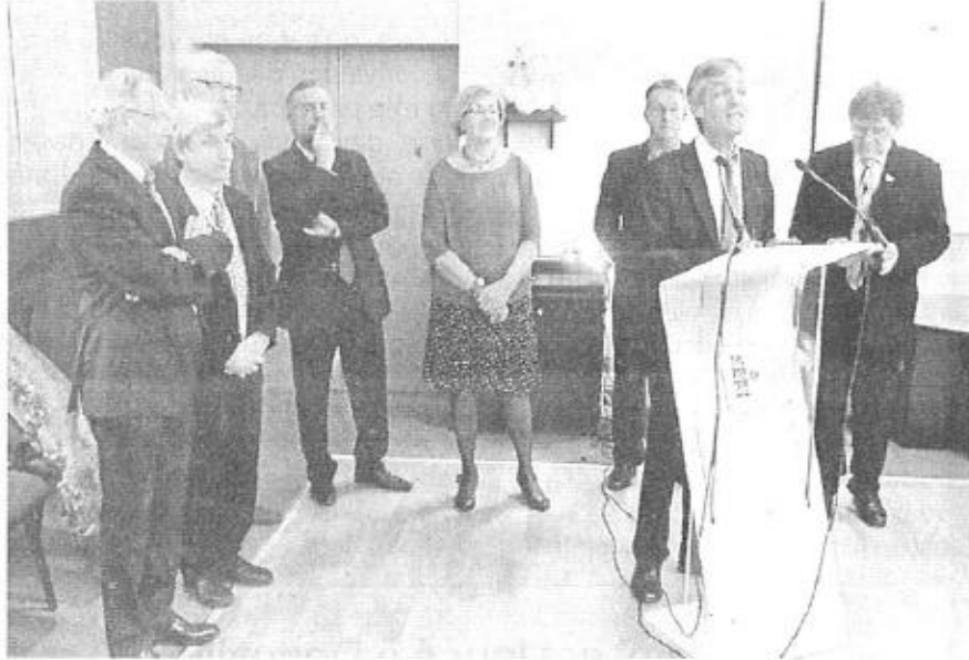
Président et vice-présidents de la CDC Val-ès-Dunes.

Pour l'intercom, le succès 2013 a été le centre nautique