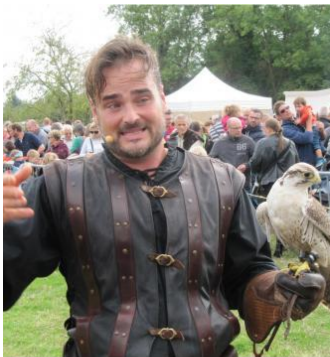
Le spectacle de la fauconnerie Di Penta a été fort apprécié par le nombreux public.

Des milliers de visiteurs sont venus assister aux animations médiévales, ce week-end. Samedi, les animations se sont déroulées pour une grande partie au Forum où étaient exposés les travaux réalisés par les élèves de l'école de Bellengreville et de Cagny. Danses, musique et un spectacle de marionnettes par la compagnie du Polisson ont agrémenté l'après-midi. Le soir, sur le parvis de l'église, un spectacle de feu présenté par la compagnie Terra Juggler est venu clore la journée.