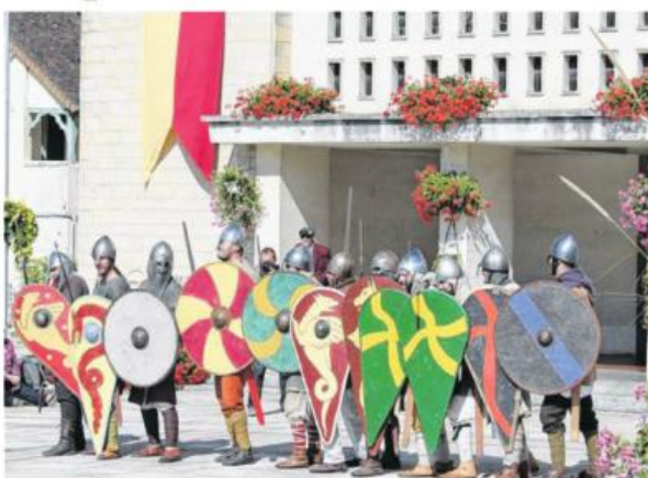
1047 - 2017 : les Médiévales ce week-end sont placées sous le signe du 970 e anniversaire de la bataille de Valès dunes. Été 1047, le jeune Duc Guillaume doit affronter les barons rebelles de l'ouest de la Normandie qui lui contestent son titre de Duc.... C'est la bataille de Valès dunes, bataille fondatrice de la saga de Guillaume de Normandie.