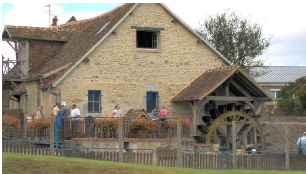
Vue du bâtiment et de la roue du moulin.

Samedi et dimanche, à l'occasion des Journées du patrimoine, le moulin de la Porte s'ouvre au public. Les visiteurs pourront acheter la farine produite en leur présence.