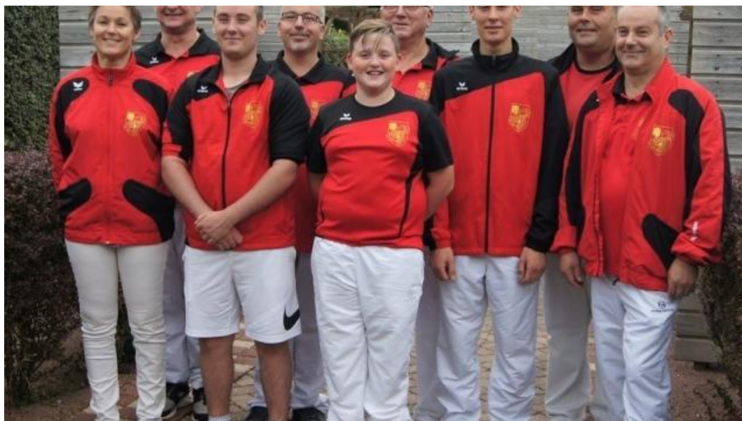
Un groupe d'archers qualifiés pour les championnats de France.