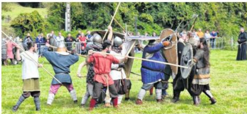
L'armée de Guillaume mène rudement la bataille...

Les différents commerçants des échoppes du marché médiéval ont réalisé pour la plupart de bonnes affaires le dimanche, compensant la faible fréquentation due à la pluie de samedi. Pendant tout le week-end, dans le camp médiéval rempli de tentes installées dans le grand champ, les membres des compagnies et associations médiévales, costumes d'époque sur le