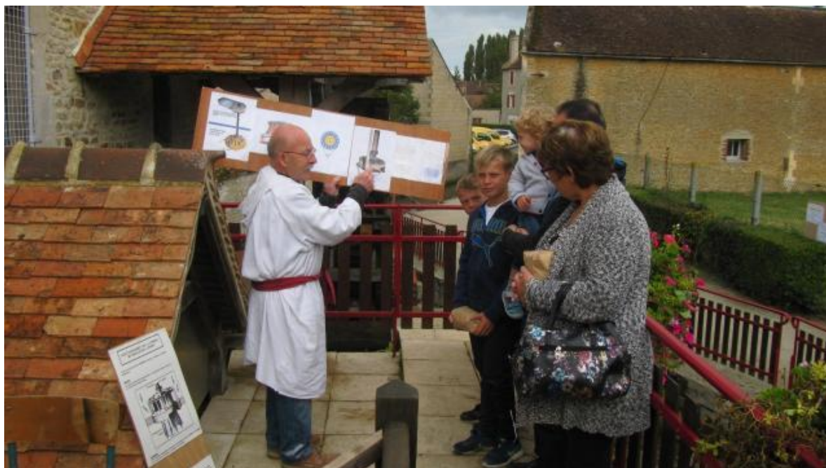
Les panneaux explicatifs se sont multipliés, pour donner un caractère pédagogique aux visites.

Le moulin de la porte d'Argences est mis en production de farine deux fois par an, lors de la Journée des moulins, en juin, et lors des Journées du patrimoine, en septembre. Le moulin était donc ouvert ce week-end. Il a accueilli presque mille visiteurs, dont beaucoup sont repartis avec de la farine bio fabriquée sur place.