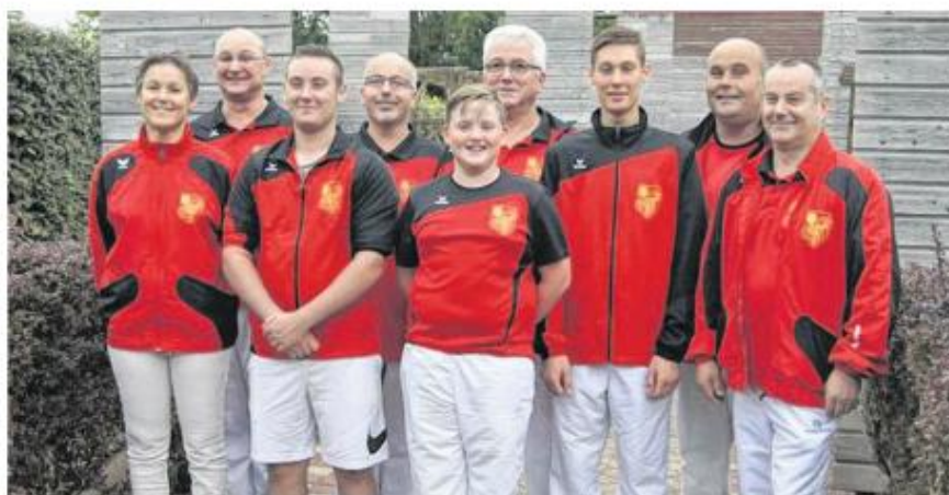
Les archers argençais lors de la finale le week-end dernier à domicile.

A l'issue de quatre mois de compétition, les résultats du concours général et du championnat du Calvados de tir au beursault ont été proclamés. Onze archers argençais ont été